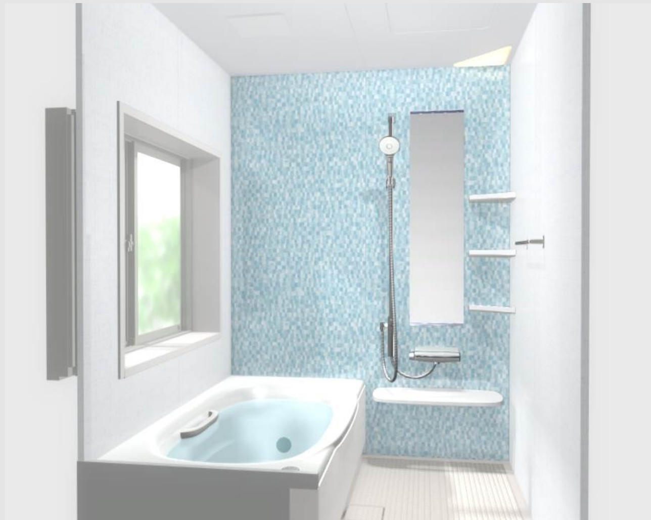
CG合成によるイメージ画像です。