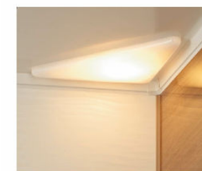
コーナーパネルライト(電球色LEDランプ60W形) LDA-P1-1A