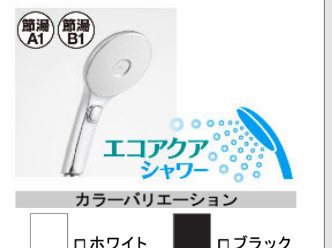
カラーバリエーション ホワイト ブラック スイッチ付エコアクアシャワー<メタル調> BF-SL6MBGE-PU/FW1