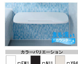
カラーバリエーション FW1 N11 Y84 まる洗いカウンター (すっきり収納タイプ)