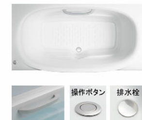
操作ボタン 排水栓 浴槽内握りバー<グレー> フッシュワンウェイ排水栓<メタル調>