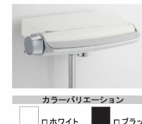
カラーバリエーション ホワイト ブラック ワイドレバー水栓 BF-WW147TXV-PU1