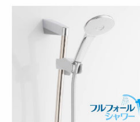
フルフォールスライドバー<メタル調> CKSB(2)-B-L1160-2/CH