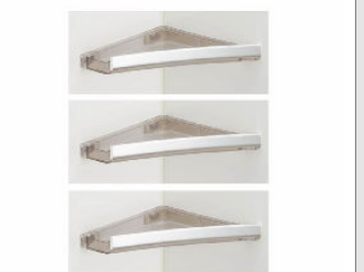
コーナーシェルフ<スモーククリア>(3段) NT-225A(6)R-1S/C02+CH (×3セット)