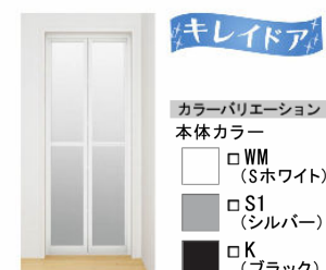
カラーバリエーション 本体カラー WM (Sホワイト) S1 (シルバー) K (ブラック) 折り戸 [11mm段差] (800W) VDY-8002006R(73)/WM