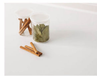
人造大理石トップ

インテリアに合わせてカラーコーディネート。耐久性にも優れた人造大理石トップです。